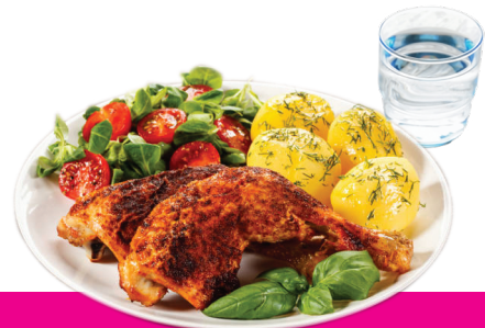
Ia inu lau fualaau Xarelto 15 mg poo le 20 mg faatasi ma se meataumafa